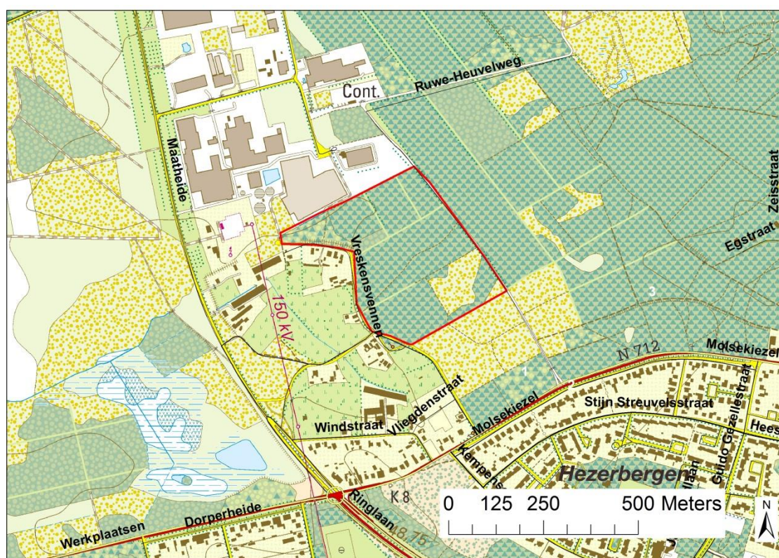
Figuur 1 Ligging van de te actualiseren percelen (rode omlijning).

Het gaat over enkele percelen in de zuidwestelijke zone van de Speciale Beschermingszone 'Valleigebied van de kleine Nete met brongebieden, moerassen en heiden' (BE2100026), ter hoogte van het toponiem Vreskenvennen in Lommel (Figuur 1).