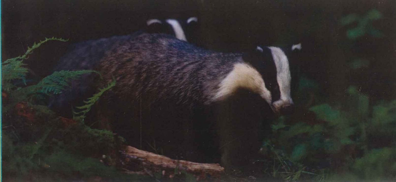
De das is goed in staat zich ongemerkt te verspreiden