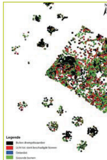
Figuur 2: Voorbeeld van een classificatieresultaat voor het bladverlies bij beuk in het Zoniënwoud op basis van een HS-index en zijn drempelwaarden. Met een groter aantal waarnemingen in de relevante schadeklassen zouden de drempelwaarden nog fijner kunnen afgesteld worden en zou de vitaliteitsbeoordeling nauwkeuriger kunnen zijn.