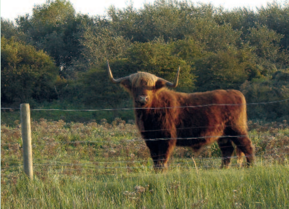
Foto 1. Schots Hooglandrund in het Vlaams natuureservaat De Westhoek.

De afgelopen decennia is in de Lage Landen veel ecologisch onderzoek uitgevoerd naar begrazing, verbreidingsmechanismen van zaden en de combinatie van beide: de verbreiding van zaden door de grazers zelf (zoöchorie). Dit is deels geïnspireerd door de grote relevantie van deze processen voor het natuurbeheer. Zo is een handvol reservaten uit de Vlaamse kustduinen het studieterrain geworden voor langlopende projecten en promotieonderzoeken naar vegetatieontwikkeling (Ebrahimi, 2007; Provoost et al., 2011), begrazing door kleine grazers (Somers, 2009), gedrag van grote grazers (Lamoot, 2004), uitwendige (Couvreur, 2005) én inwendige zoöchorie (Cosyns, 2004; D'hondt, 2011). Doordat de ene studie op de resultaten van de andere kon voortbouwen, leidde het werk omtrent elk van deze facetten tot een onschatbare culminatie van kennis. Wij gingen echter nog een stapje verder: met de combinatie van deze data kunnen immers processen en patronen worden becijferd die anders moeilijk of niet te doorgronden zijn.