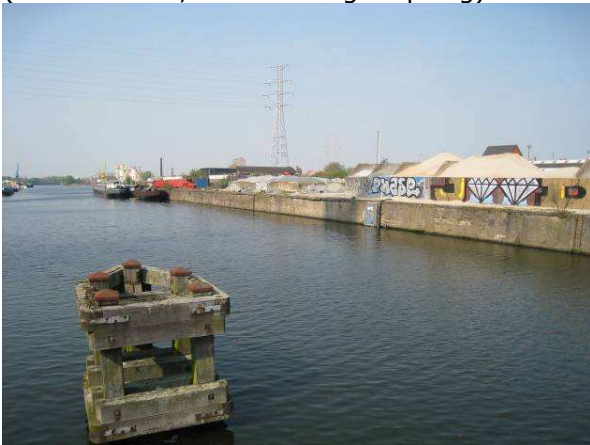
Figuur 5. Handelsdok. Beeld van de huidige kaaimuren Handelsdok.