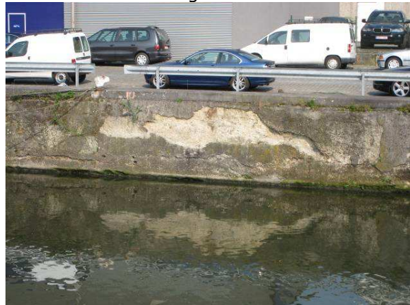
Figuur 6. Handelsdok. Detailbeeld.