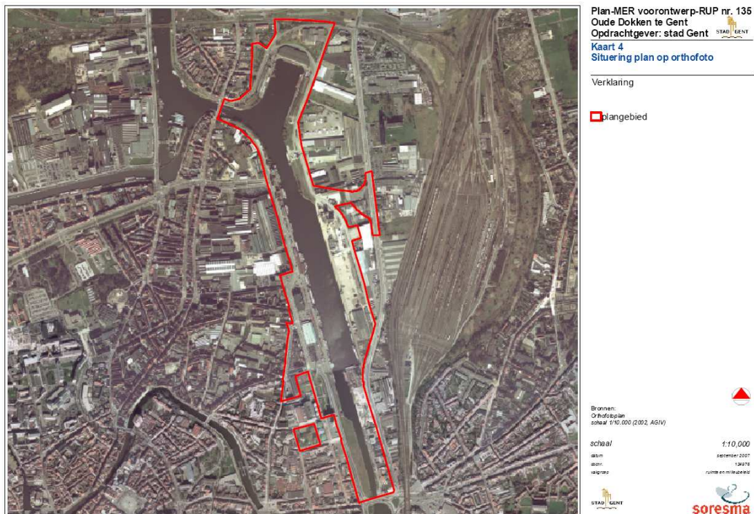
Figuur 1. Situering van het project gebied

Deze nota behandelt de muurflora van het Achterdok en Handelsdok. Een tweede nota zal de muurflora bespreken van het Houtdok.