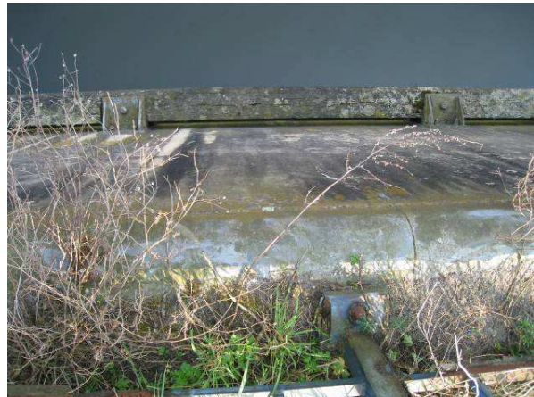
Figuur 4. Achterdok. Linkeroever (oostelijke expositie) met verticale kaaimuur bestaande uit betonplaten. Nagenoeg zonder ontwikkelde muurvegetatie.