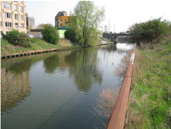
Figuur 3. Achterdok. Rechteroever (westelijke expositie) met schuin talud met verruigde grasvegetatie en struiken (Vlinderstruik, Vlier en wilgenopslag)

Gezien de beperkte natuurlijkheid binnen het huidige Achter- en Handelsdok is er een meerwaarde te creëren door te werken met natuurvriendelijke vooroevers op plaatsen waar dit inpasbaar is in het uitwerken van het algemene plan – 'Oude Dokken'.