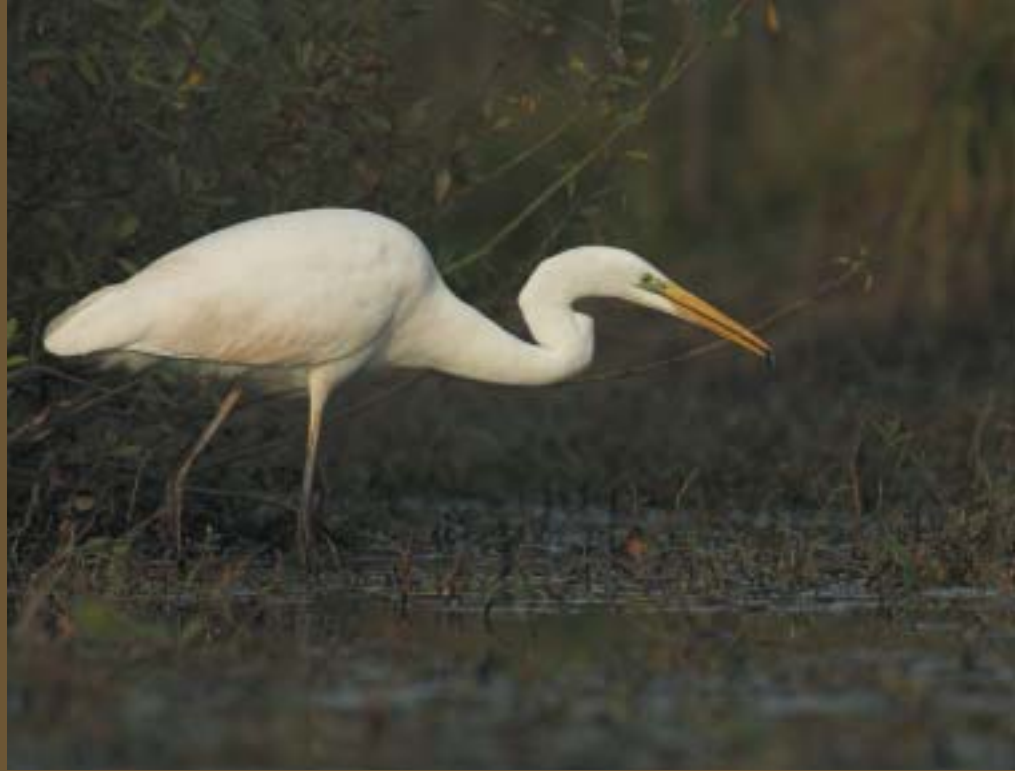
Grote Zilverreiger - Glenn Vermeersch

Het langstlopende monitoringproject in Vlaanderen kan blijven rekenen op de medewerking van een grote schare vrijwilligers. Samen met de onverdroten inzet van de regionale coördinatoren en vogelwerkgroepen, de ondersteuning van Natuur.Studie én de mogelijkheid om nu via het internet gegevens in te voeren en te kunnen raadplegen, heeft dit ervoor gezorgd dat er nooit eerder zoveel tellingen werden verricht en doorgegeven. Het aantal getelde vogels in de voorbije 'kwakkelwinter' volgde die trend echter niet. In deze bijdrage overlopen we kort de eerste bevindingen van het telseizoen 2006/07.