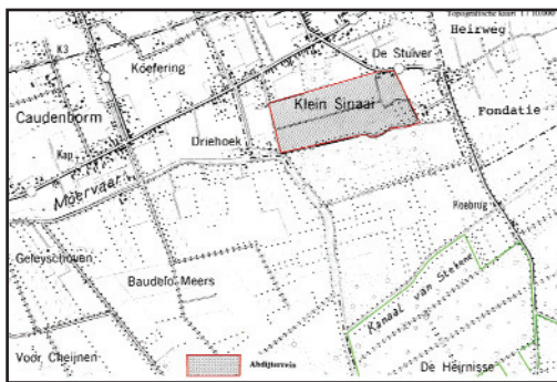
Situering van de abdij van Boudelo