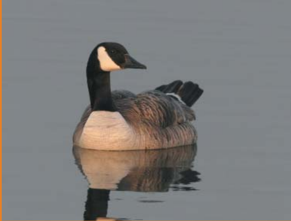
Canadese Gans - Koen Devos