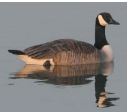
Canadese Gans - Koen Devos

In het Waasland (inclusief Linkeroever) waren er concentraties aan de Putten (west) te Kieldrecht (195 ex.) in het Molsbroek te Lokeren (184 ex.), aan de Kleiputten Hofstraat te Tielrode (124 ex.) en aan De Bunt te Hamme (83 ex.). In heel de Kruibeekse Polder samen zaten 358 ex. Op een aantal plaatsen werden nog telkens enkele tientallen vogels gezien. In het totaal werden er in deze zone 1168 ex. waargenomen. In de Leie-Scheldevalleizone ten zuiden van Gent zaten duidelijk meer grotere groepen. In de Leievallei werden 283 ex. bij Ooidonk en 347 ex. aan de Vosselareput/Leyhoek te Bachte/Astene waargenomen. In de Scheldevallei werden 361 ex. gezien aan de Reymere te Merelbeke, 127 ex. aan de Spanjaard te Zevegem, 100 ex. aan de Grootmeers en Mesure te Zingem, 82 ex. aan de Golf de Ghellinck te Elsegem en 79 ex. in de Scheldemeersen te Oudenaarde. Elders waren er nog verschillende groepen van meerdere tientallen. In het totaal werden in de hele zone 1856 vogels gezien.