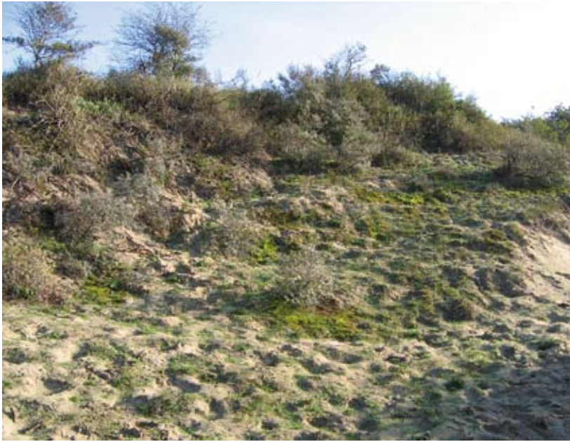
Figuur 3. Het duinviooltje groeit vooral op zonnige hellingen in open duingebieden, waar nog enige verstuiving plaatsvindt.

de vrouwtjes van de kleine parelmoervlinder als ideale afzetplanten worden gebruikt, te beschermen tegen betreding en te sterke vertrapping door grazers. Dit kunnen we doen door de duinviooltjes omgeven door mos in gebieden die vlak bij de zeelijn liggen af te rasteren tijdens de wintermaanden. In meer landinwaarts gelegen duingebieden rasteren we dan weer duinviooltjes omringd door zand tijdelijk uit. Elke winter kunnen andere geschikte plekken afgerasterd worden, zodat verstruweling van deze zones wordt verhinderd. Buiten het winterseizoen is afrastering minder noodzakelijk omdat de grazers dan eerder grasrijkere gebieden in de duingebieden opzoeken en de zand- en mosrijke plekken eerder lijken te vermijden. Bijkomend onderzoek naar de effecten van begrazing zelf zou informatie kunnen opleveren over het directe (vertrapping) of indirecte (verstoring van mieren die instaan voor verbreiding van zaden) effect op het duinviooltje zelf.