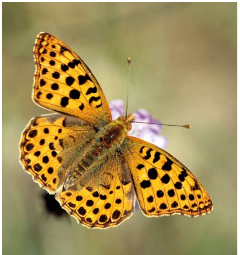
Figuur 1. De kleine parelmoervlinder onderscheidt zich door het stippenpatroon op de bovenkant gemakkelijk van andere parelmoervlinders.

Anderzijds creëert begrazing net kortgrazige plekken en open en gevarieerde vegetaties waar de kleine parel-