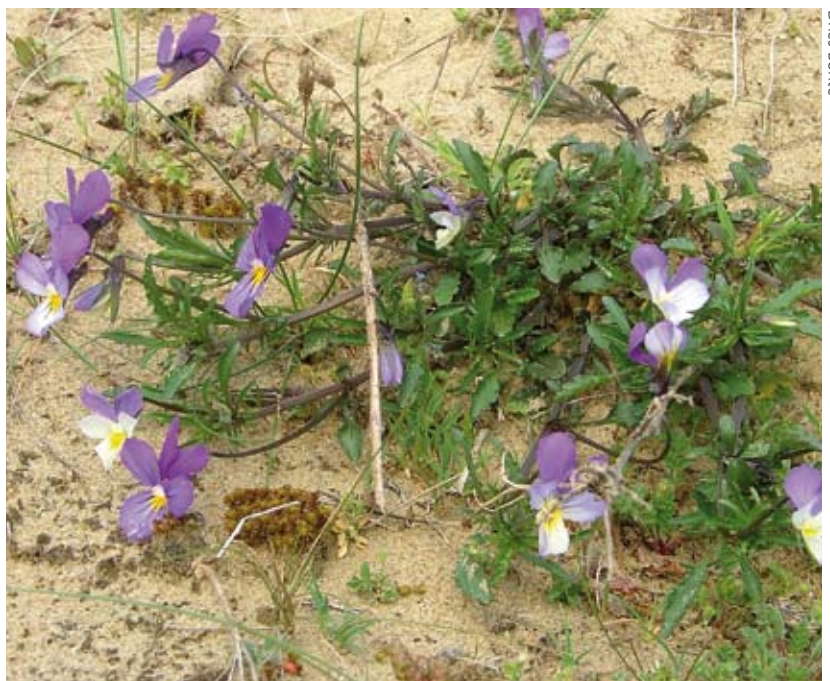
Figuur 2. De voornaamste waardplant van de kleine parelmoervlinder in de duinen is het duinviooltje.

moervlinder nood aan heeft. Een goede controle op de grasdruk is dus belangrijk. In gebieden met kleine populaties van de kleine parelmoervlinder, lijkt het dan ook zinvol om er voor te zorgen dat (een deel van) de duinviooltjes die door