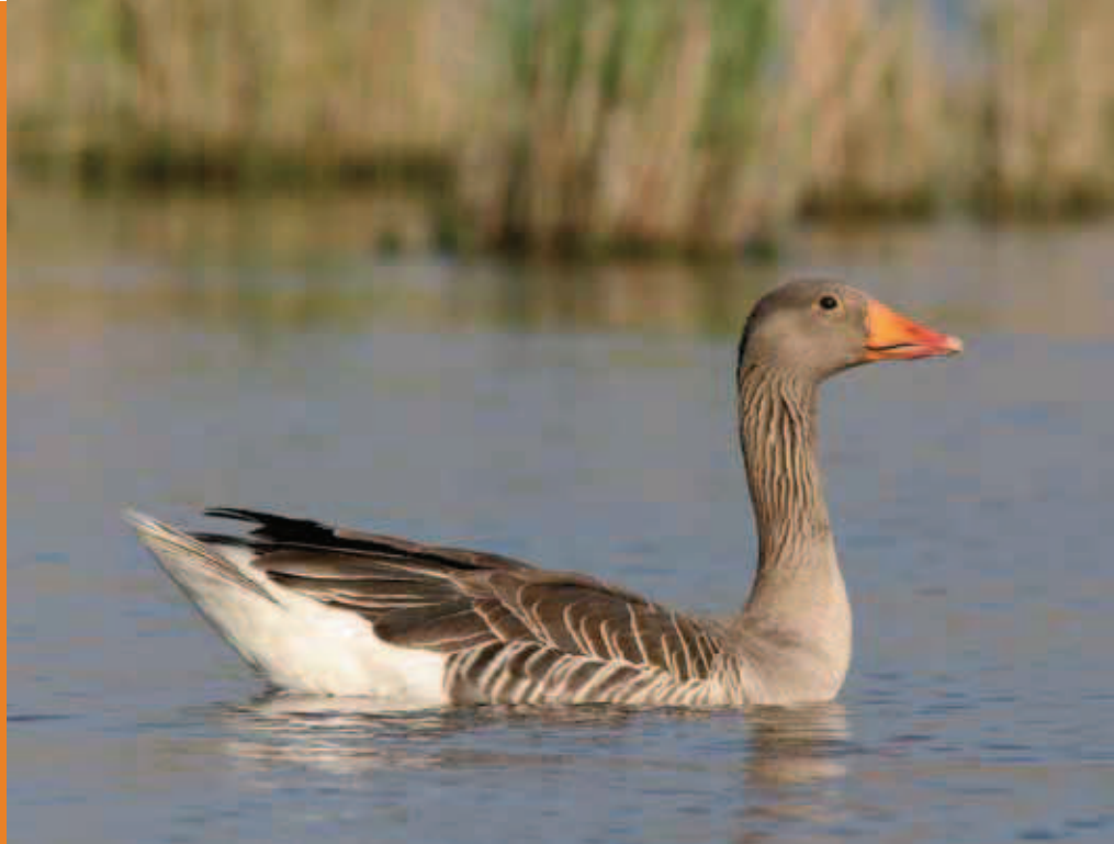
Grauwe gans - Koen Devos

Op vraag van enkele projectpartners werd binnen het project Invexo ( www.invexo.be ) door INBO-medewerkers in juni een zomerganzentelling georganiseerd in West-Vlaanderen. Het was in 2010 moeilijk gebleken om een volledig beeld te krijgen van de ruilocaties. Hierdoor bleef in dat jaar het aantal afvangstacties, een van de pijlers van het ganzenbeheer binnen Invexo, beperkt in West-Vlaanderen. We concentreren ons in deze bijdrage op Canadese en grauwe gans, de twee meest voorkomende soorten in het projectgebied waarvan de populaties in het kader van Invexo worden beheerd.