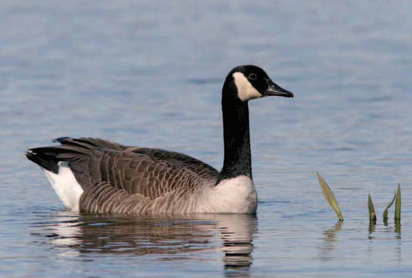
Canadese gans - Koen Devos

sen zich tijdelijk en soms over grote afstanden naar andere gebieden om er de rui door te brengen. Dit maakt dat simultaantellingen tijdens het broedseizoen en in de ruiperiode geen goed beeld geven van de maximale aantallen ganzen die in de zomerperiode aanwezig kunnen zijn. Zoals reeds eerder was vastgesteld is half juli een meer geschikte periode voor het tellen van zomerganzen is (HUYSENTRUYT et al. 2010). De meeste vogels broeden dan niet meer, de jongen zijn vliegvlug maar zitten nog in de buurt van de broedgebieden. De vogels zijn niet meer in de rui maar zitten toch nog geconcentreerd zodat ze goed te tellen zijn. Om de trend in de Vlaamse post-broeding populatie op te volgen zijn de watervogeltellingen in de winterperiode (oktober-maart) goed bruikbaar.