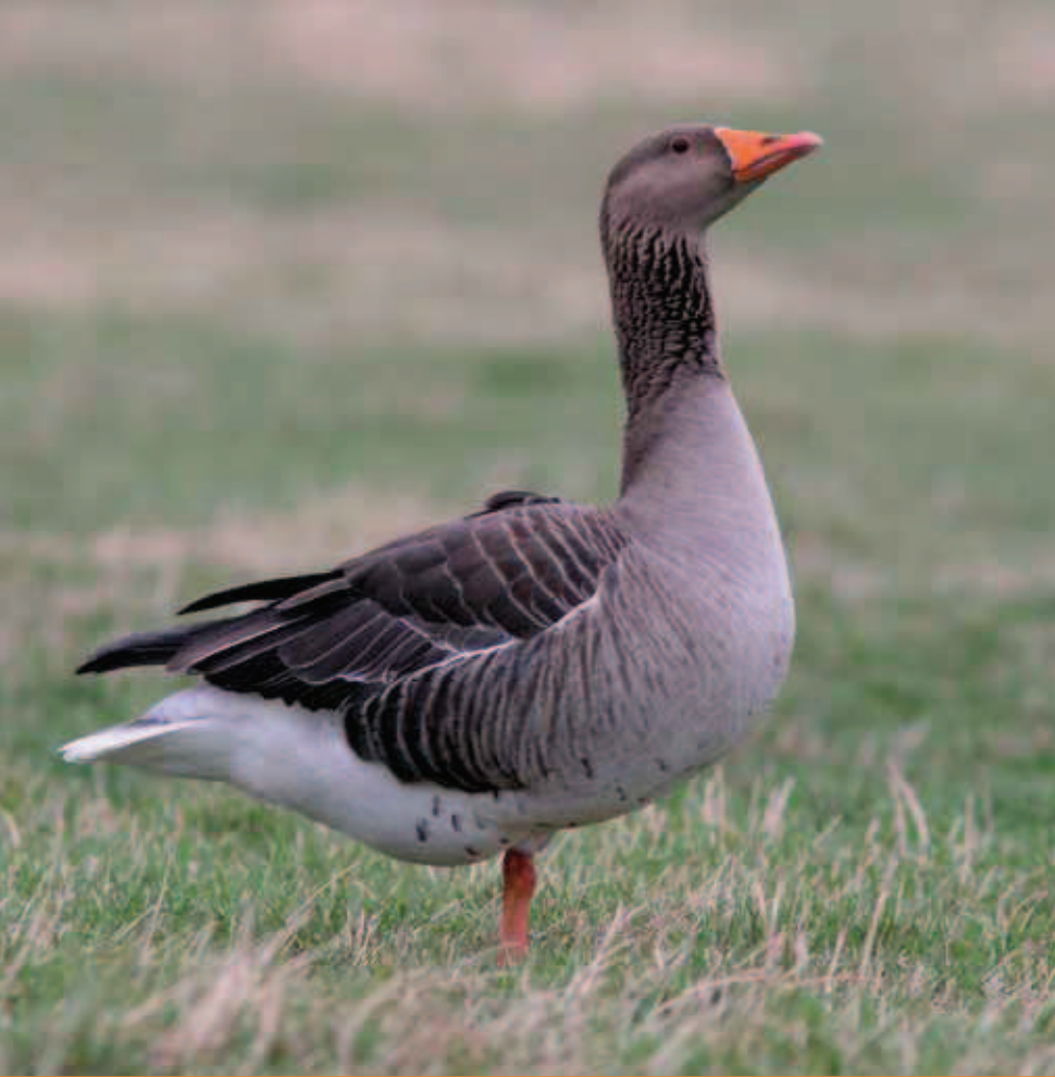
Grauwe gans - Koen Devos