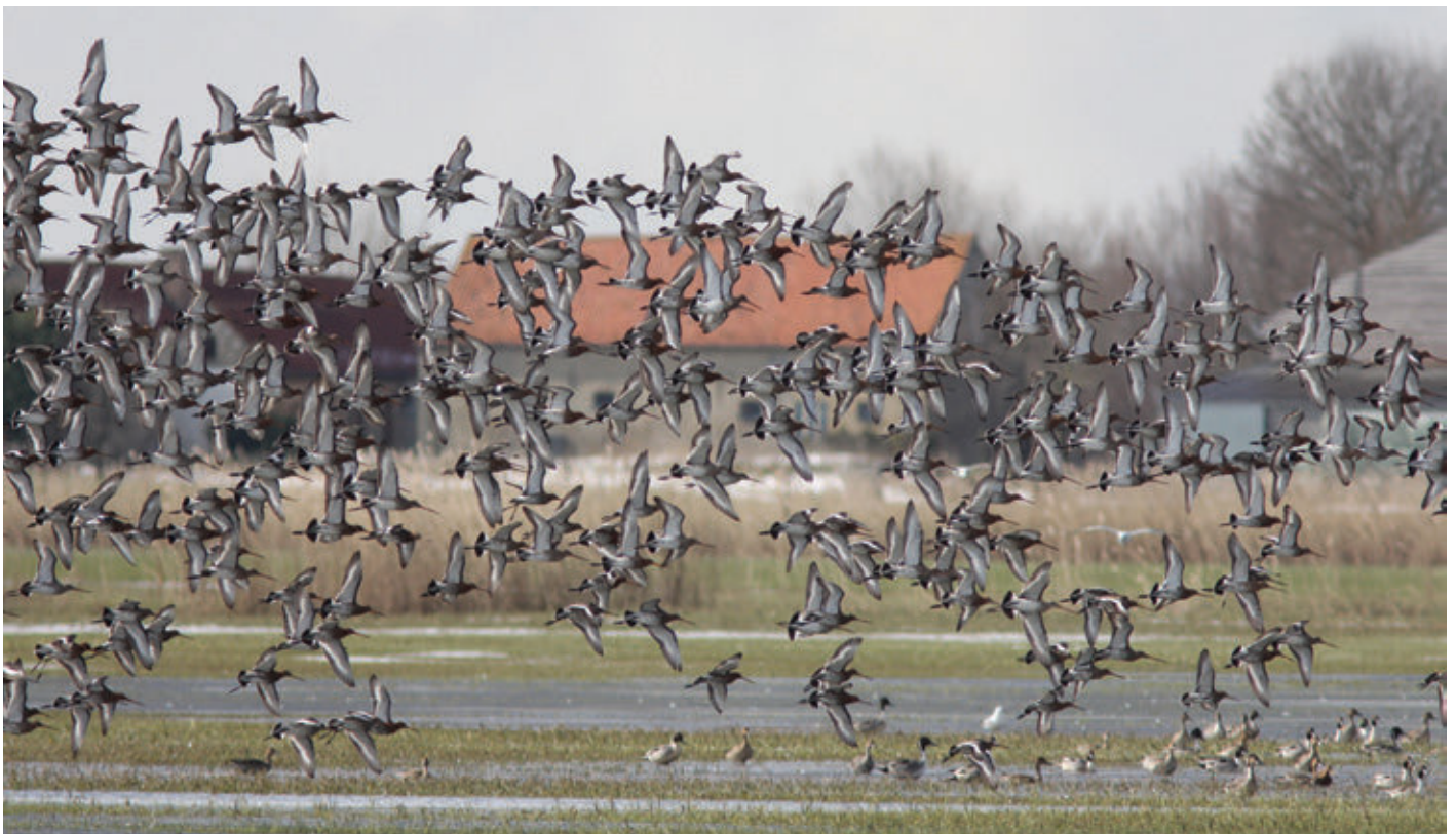
► Grutto's Limosa limosa en Pijlstaarten Anas acuta . 14 maart 2013. Lo-Reninge (W)

De voorjaarstrek van Grutto's Limosa limosa ondervond in 2013 veel hinder van ongunstige weersomstandigheden. Als gevolg van strenge vorst, zware sneeuwval en een gure wind zagen veel vogels zich genoodzaakt om de trek te onderbreken ter hoogte van Noord-Frankrijk en het westen van Vlaanderen. Op verschillende plaatsen werden uitzonderlijk hoge aantallen pleisterende vogels waargenomen.