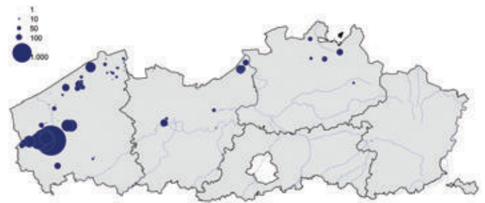
» Figuur 2. Verspreiding van pleisterende Grutto's Limosa limosa in Vlaanderen tijdens de midmaandelijke watervogeltelling op 16 en 17 maart 2013.

Op 7 en 8 april kregen we eindelijk de lang verwachte weersomslag die het einde van de winter inluidde. De koude NO-wind zwakte af en veranderde later van richting. Nachtvorst bleef achterwege. De aantallen pleisterende Grutto's in Vlaanderen namen nu snel af. Het broedseizoen kon beginnen.