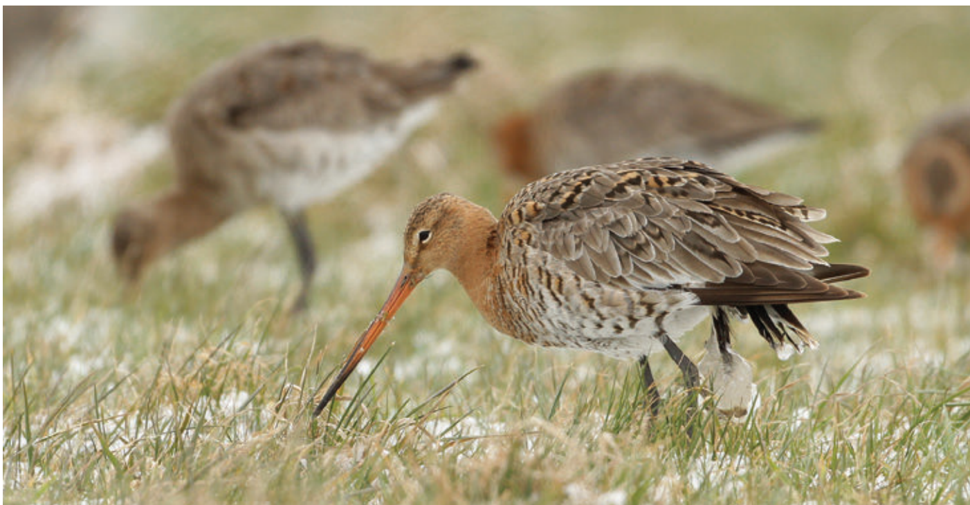
▶ Grutto Limosa limosa . 24 maart 2013. Uitkerke (W)

'officiële' schatting van de West-Europese deelpopulatie van de nominaatvorm bedraagt 160.000 tot 180.000 vogels (Wetlands International 2014). Op basis van recente analyses van kleurringgegevens wordt de populatiegrootte tegenwoordig echter eerder geschat tussen 133.000 en 140.000 exemplaren (Lourenço et al. 2010). De IJslandse populatie is met 50.000 tot 75.000 individuen aanzienlijk kleiner. De 1% norm van beide populaties bedraagt respectievelijk 1700 en 610 exemplaren (Wetlands International 2014). Een deel van de doortrekkers in Vlaanderen behoort tot de IJslandse populatie. Vooral goed uitgekleurde mannetjes zijn vrij eenvoudig te onderscheiden van hun soortgenoten van de nominaatvorm. Bij mannetjes in winterkleed en vrouwtjes ligt het iets moeilijker. Het is niet gemakkelijk om bij tellingen telkens systematisch de vogels van de IJslandse ondersoort er uit te halen, zeker bij grote groepen. Op basis van steekproeven bleek in maart 2013 het aandeel (typische) IJslanders vaak rond de 10% te liggen, soms iets hoger. Bij dat percentage moet enige reserve in acht worden genomen, maar dit zou impliceren dat bij het maximumaantal van 5500 ex. in de IJzerbroeken wellicht minstens een 600-tal tot de IJslandse ondersoort behoorden en dat dus de 1%-norm net gehaald werd. De 5000 ex. die behoren tot de nominaatvorm vertegenwoordigden ongeveer 3 % van de respectievelijke populatie. Het ging dus in beide gevallen om internationaal belangrijke concentraties.