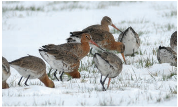
» Grutto Limosa limosa . 12 maart 2013. Ledegem (W). Filmbeelden van deze Grutto's die in de sneeuw hun kostje bijeen proberen te scharrelen terwijl ze gestalkt worden door agressieve meeuwen, vind je op youtube (zoekopdracht "Grutto's Ledegem").

Op 9 maart kregen de massaal doortrekkende Grutto's boven Noord-Frankrijk en België een onaangename verrassing te verwerken. De temperatuur kende plots een sterke terugval waardoor er boven het natte Vlaanderen op grote schaal mist ontstond. Veel doortrekkende steltlopers zagen zich genoodzaakt om de trek te onderbreken en aan de grond te komen. Ondermeer in Zuid-West-Vlaanderen en de Oost-Vlaamse regio Schelde-Leie werden op tal van plaatsen ongewone aantallen steltlopers gesignaleerd. Zo landden op een overstromde akker in Ouwegem (O) een groep van 44 Bonte Strandlopers Calidris alpina en op een akker in Moen (W) een groep van 17 ex. Het meest opvallend waren de grote groepen Grutto's. Bij valavond zaten er in de Heulebeekmeersen rond Ledegem (W) zo'n 450 en in de West-Vlaamse Scheldemeersen meer dan 500 op elkaar gepakt. De dag erna leverde een totaaltelling in de IJzerbroeken tussen Diksmuide en de Frans-Belgische grens ruim 1750 ex. op. De vogels profiteerden volop van de vele ondergelopen graslanden en akkers die een optimaal foerageer- en rustgebied vormden.