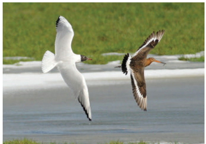
» Kleptoparasitisme van Kokmeeuw Larus ridibundus op Grutto Limosa limosa . 12 maart 2013. Heulebeekmeersen Ledegem (W)

Midden maart steeg de gemiddelde temperatuur opnieuw boven het nulpunt. In het zuiden van West-Vlaanderen namen de aantallen Grutto's met het verdwijnen van het water in de overstromde weilanden geleidelijk af, terwijl de aantallen in de nog steeds zeer drassige IJzerbroeken recordhoogtes bereikten (Figuur 1). Op 15 en 16 maart werden er in de IJzerbroeken bijna 5500 exemplaren geteld, met als grootste groep 3070 exemplaren in het Westbroek in Reninge. In de nabijgelegen Handzamevallei pleisterden tot ongeveer 800 Grutto's. Ook in de rest van Vlaanderen werden meer