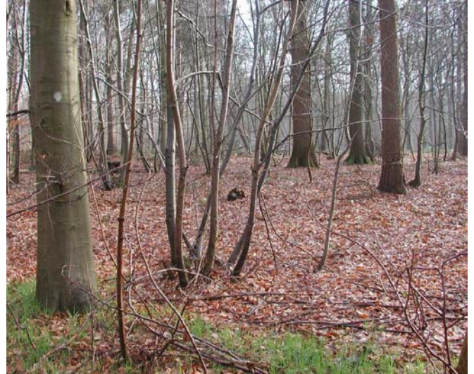
Typisch beeld van het integraal reservaat in Wijnendale: oude middelhoutbestanden van vooral eik, en een gemengde hakhoutlaag.

Het integraal reservaatdeel bevat een groot aantal zware eiken, essen en populieren. Door zijn voorgeschiedenis is er in het bos reeds een behoorlijke hoeveelheid dood hout aanwezig, zoals geïllustreerd wordt door de stamvoetenkaart die de kernvlakte en de directe omgeving weergeeft.